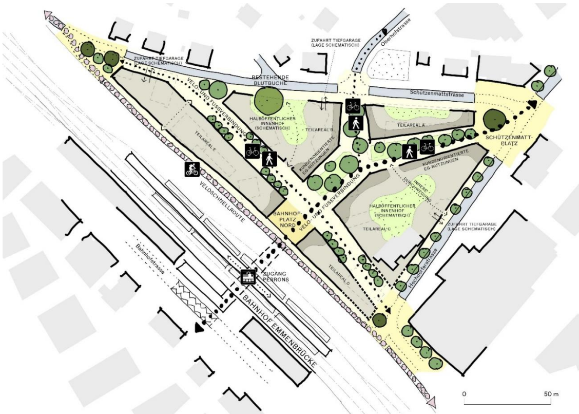
Der Schemaplan schafft eine Übersicht, wie die angedachten Nutzungen angeordnet werden können. (Grafik: Han Van de Wetering)