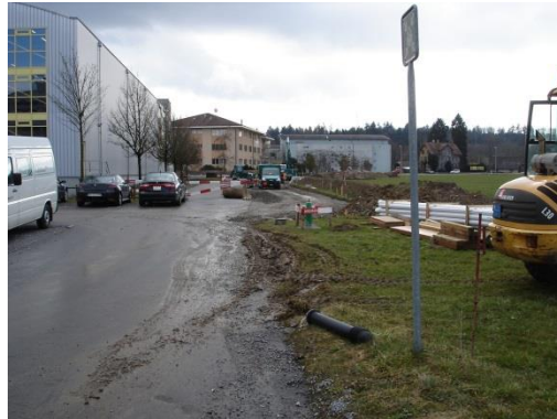
Strasse Südwest im Bau; März 2009