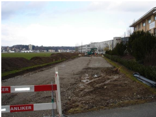
Strasse Südwest im Bau; März 2009