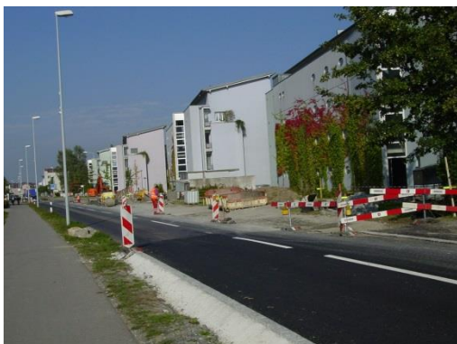
Aufweitung der Seetalstrasse im Bau; September 2003