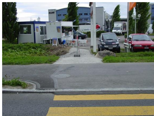
Zusätzlicher Verbindungsweg im Bereich Lipo; September 2004