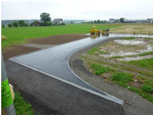
Zusätzliche Erschliessung Leibundgut im Bau; Juli 2012