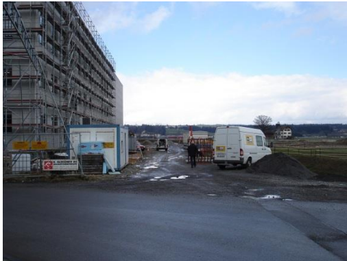
Strasse Nordost im Bau; März 2009