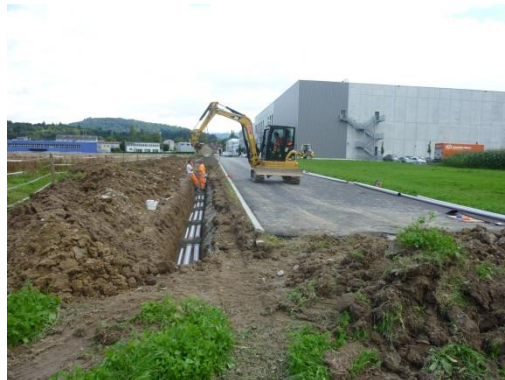
Zusätzliche Erschliessung Nordost im Bau; August 2010