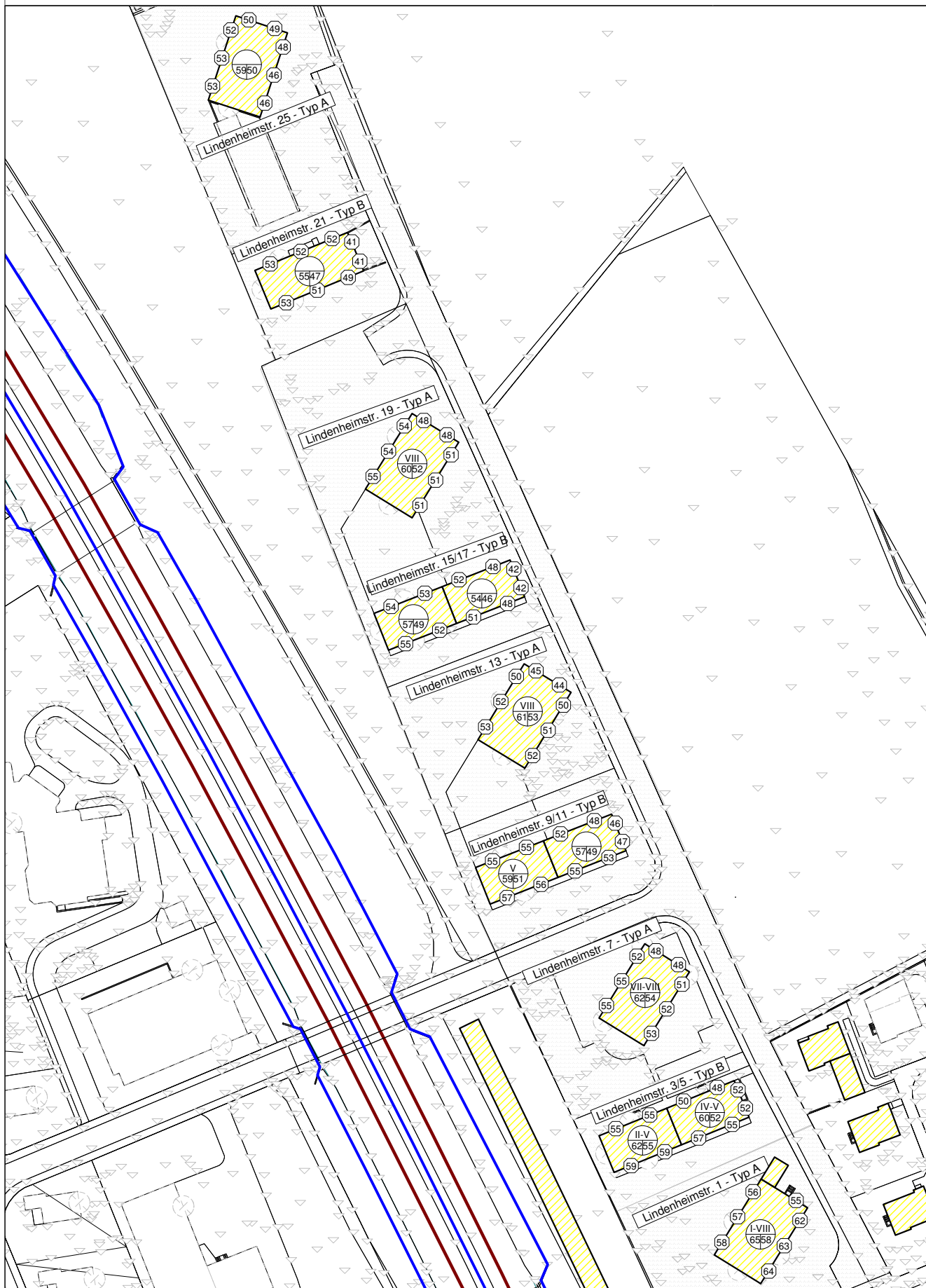
Beurteilungspegel Tag - EG bis 2. OG