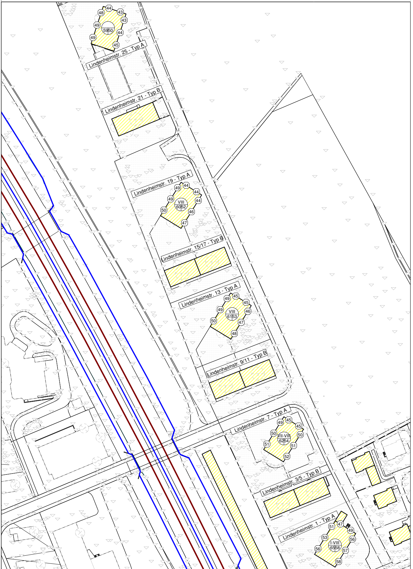
Beurteilungspegel Nacht - 6. OG