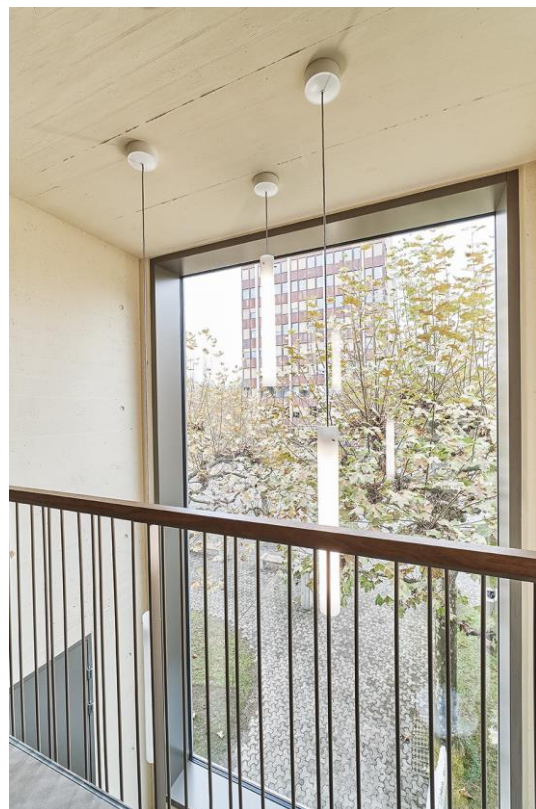
Aussicht auf Verwaltungsgebäude