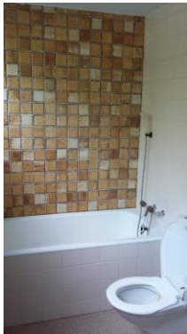
Vor dem Umbau